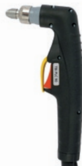
TBi PLC 90

70 A / 60% воздух, 4.5-5.0 bar 130 л/мин воздушное CEBORA® P70