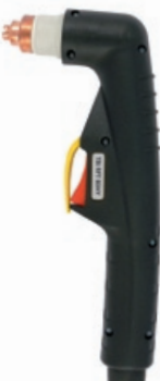
TBi RPT 80HY

* Tbi RPT 80HY и Tbi RPT 100HY с контактным поджигом