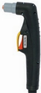
TBi PLC 60

Все плазматроны с внутренней пилотной дугой и высокочастотным поджигом *