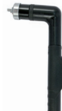
TBi PLC 250W

150 A / 60% воздух, 4.5-5.0 bar 220 л/мин воздушное CEBORA® P150, CB160