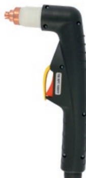
TBi RPT 100HY

80 A / 60% воздух или N 2 , 4.4-5.0 bar 110 л/мин воздушное Hypertherm® Powermax 600, 800, 900