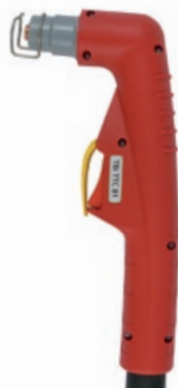
TBi TTC 81

120 A / 60% воздух или N 2 , 4.6-5.0 bar 200 л/мин воздушное Hypertherm® Powermax 1000, 1250, 1650