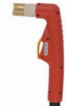
TBi TTC 151

150 A / 60% воздух, 4.5-5.0 bar 220 л/мин воздушное TRAFIMET® A140, Ergocut A141