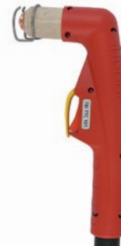
TBi TTC 101

80 A / 60% воздух, 4.5-5.0 bar 160 л/мин воздушное TRAFIMET® A80, Ergocut A81