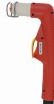
TBi TTC 141

100 A / 60% воздух, 4.5-5.0 bar 180 л/мин воздушное TRAFIMET® A90, Ergocut A101