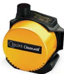
CA BASIC Flow Control