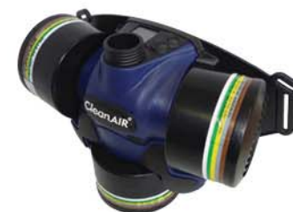
CA CHEMICAL 3F