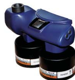
CA CHEMICAL 2F