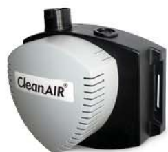
CA UTILITY UNIT