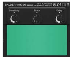
V913 DS ADC