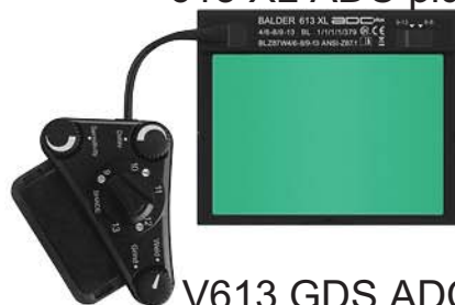
613 XL ADC plus