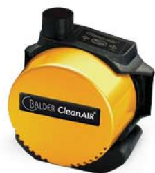
CA BASIC Dual Flow