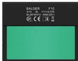
F10 / F11