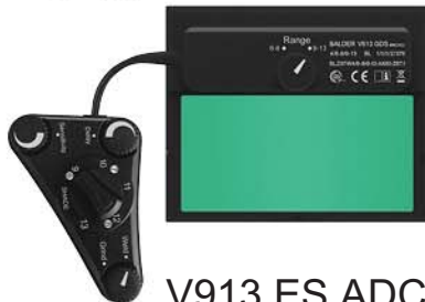
V913 ES ADC